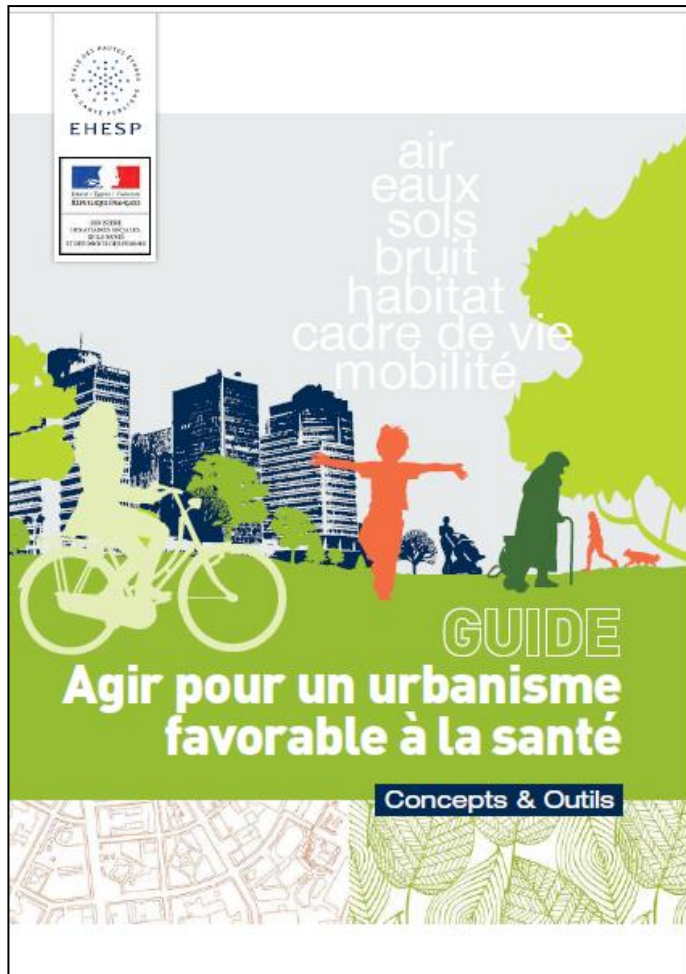
EHESP-ARS Bretagne 2014